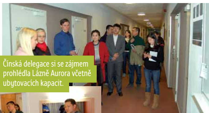
Čínská delegace si se zájmem prohlédla Lázně Aurora včetně ubytovacích kapacit.

do Třeboně, kde kromě podrobné prohlídky našich lázní navštívili i Státní oblastní archiv. Zástupci čínské delegace by nyní ve své provincii Henan měli představit Jihočeský kraj jako místo vhodné pro turistiku. Jsme toho názoru, že