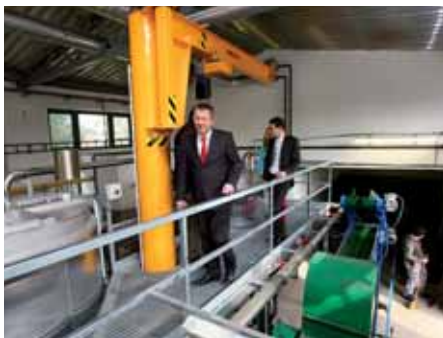
↑ Ministr Němeček si se zájmem prohlédl přípravnou slatinu i nově zrekonstruované slatinné prostory.

Myslím, že se tady udělal skvělý kus práce, že ta investice má smysl. To, že se prostory zmodernizovaly, znamená, že se zde pacientům bude líbit a zaměstnancům se tady bude dobře pracovat. Zachovalo se přitom to, co se mi na Bertiných lázních vždy nejvíce líbilo – jistá ko-