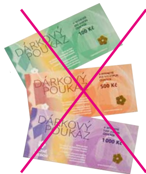
Platnost těchto poukazů končí 30. června 2023

Zároveň je již v prodeji nová edice dárkových poukazů, kterou je možné objednat v našem e-shopu nebo zakoupit v recepcích obou lázeňských domů. Pokud přemýšlíte, co věnovat jako dárek svým blízkým, tip je jasný. Nové dárkové poukazy jsou platné do konce roku 2024. <