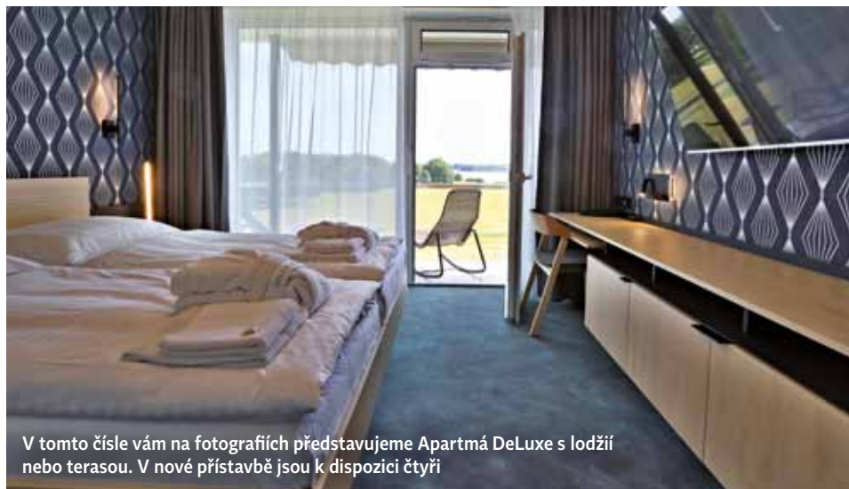
V tomto čísle vám na fotografiích představujeme Apartmá DeLuxe s ložicí nebo terasou. V nové přístavbě jsou k dispozici čtyři