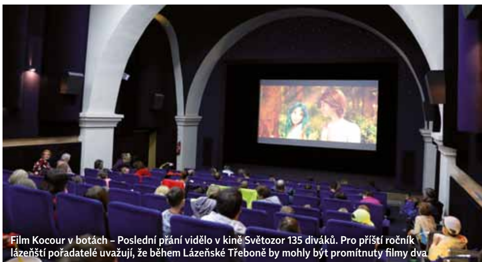
Film Kocour v botách - Poslední přání vidělo v kině Světozor 135 diváků. Pro příští ročník lázeňští pořadatelé uvažují, že během Lázeňské Třeboně by mohly být promítnuty filmy dva

Stánky lázní nabídly návštěvníkům a zájemcům informace o provozech, odnést si mohli také pytlíčky se slatinou, propagační materiály, či děti balónek. Novinkou byla anketa k samotné akci, kde jsme se návštěvníků ptali, jak se o akci dozvěděli, o jaký typ návštěvníka se jedná apod. Pět z nich, kteří anketu úspěšně odeslali, bylo vylosováno a obdrželi dárkové poukazy na služby lázní. Šíření informace o anketě proběhlo prostřednictvím vy-