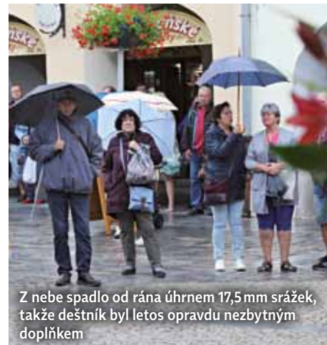
Z nebe spadlo od rána úhrnem 17,5 mm srážek, takže deštník byl letos opravdu nezbytným doplňkem

Čech, kteří preferují několikadenní či jednorázový příjemný odpočinek a relaxaci. V našich lázních skutečně očekávejte pohazení pro vaše tělo a duši," doplňuje Jan Váňa.