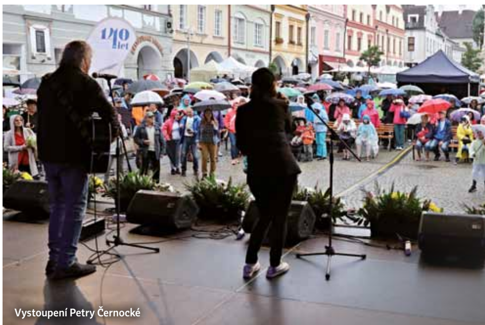
Vystoupení Petry Černocké