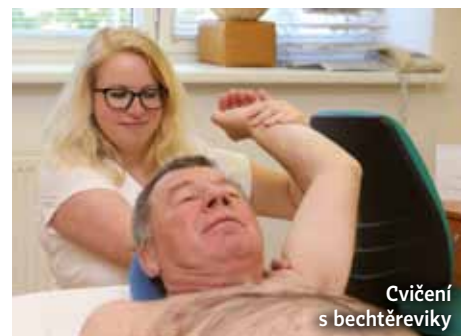
Cvičení s bechtěrevikou

Necítím se být žádným alternativcem, ale cokoliv, co přispěje ke zlepšení psychiky či sníží neuduhy, je prospěšné. A naše procedury by v tomto směru měly pomáhat. Jejich značná část je obdobná jako na běžných rehabilitačních pracovištích. Ale potom jsou některá lázeňská specifika – využívání přírodního léčebného zdroje. V případě našich lázní v Třeboni to je slatina. Co se týká vámi zmiňovaných procedur – jedná se o sofistikované přístroje, jejichž funkční princip vychází z běžnějších léčebných prostředků. Zmíním například laser, mechanickou masáž či prohřátí a jejich kombinace mezi sebou. Takže věřím tomu, že i tyto přístroje mají léčebné účinky. <