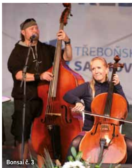
Bonsai č. 3