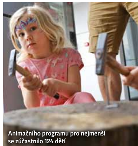
Animačního programu pro nejmenší se zúčastnilo 124 dětí