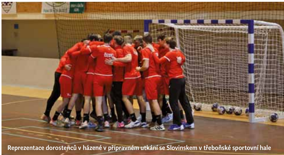
Reprezentace dorostenců v házené v přípravném utkání se Slovinskem v třeboňské sportovní hale

Začátkem listopadu, v letošním roce již potřetí, v Lázeňském domě Aurora rozbalil svůj kemp širší výběr reprezentačního týmu mladých házenkářů. Během týdenního pobytu se podle kouče Jiřího Hynka nový dorostenecký tým zaměřil na budování herního stylu a vytvoření vazeb mezi hráči v obraně i v útoku. K tréninkům mladí reprezentanti využívali halu v sousedství lázní, kde také odehráli dvě kvalitní přátelská utkání s velmi silným Slovin-