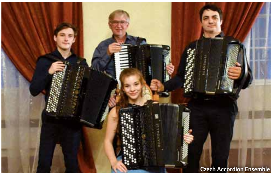
Czech Accordion Ensemble