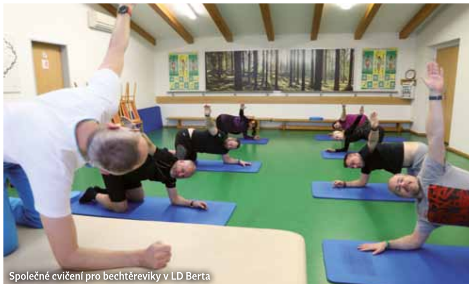
Společné cvičení pro bechtěreviky v LD Berta

V našich lázních do programu pro tyto nemocné patří především slatinná koupel s navazující částečnou ruční masáží a individuální 30minutové i skupinové hodinové cvičení. Léčebný plán se potom doplní dle aktuálních problémů každého pacienta. <