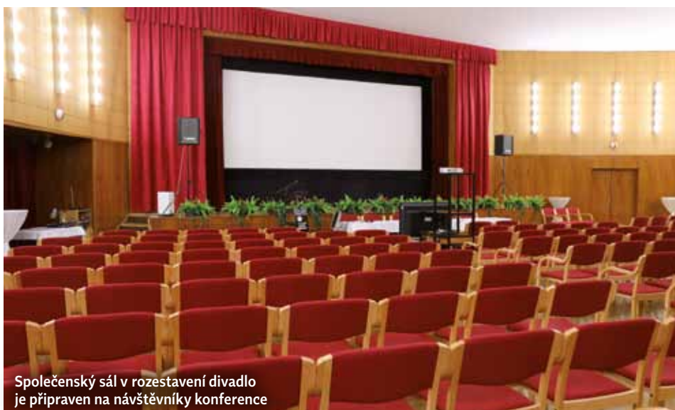
Společenský sál v rozestavení divadlo je připraven na návštěvníky konference

↑ Připravena je i konferenční technika, ozvučení, obrazovka pro přednášejícího a předsedající. IT podpora je samozřejmostí