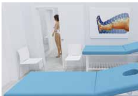
Lymfologická ambulance – pracoviště se buduje v přízemí Lázeňského domu Aurora. Zpřístupnění klientům lázní i veřejnosti je v plánu na léto 2024

25. května – Otevírání lázeňské sezony 2024, kde se s vámi rád potkám.