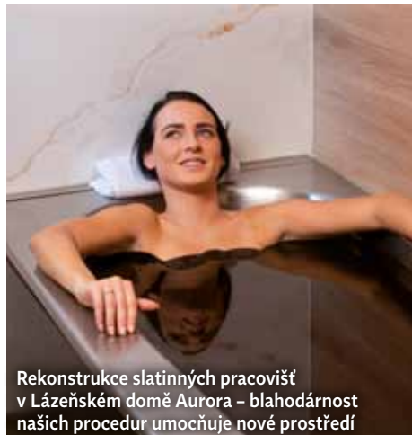
Rekonstrukce slatinných pracovišť v Lázeňském domě Aurora – blahodárnost našich procedur umocňuje nové prostředí