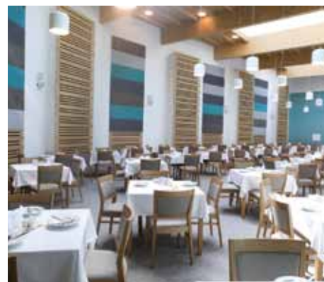
Během rekonstrukce Lázeňského domu Berta v roce 2020 vznikla i nová jídelna pro klienty

Jsem rád, že Slatinné lázně Třeboň jsou puncem kvality v lázeňské i wellness péči. Od roku 2018 se nám povedlo plně zrekonstruovat náš Lázeňský dům Berta. Stavební práce a úpravy proběhly v letech 2019–2020. Jednalo se o investici ve výši 252 milionů Kč. Nešlo o jednoduchý projekt, ale vše se podařilo. Těší mě také, že se nám společně s vedením města