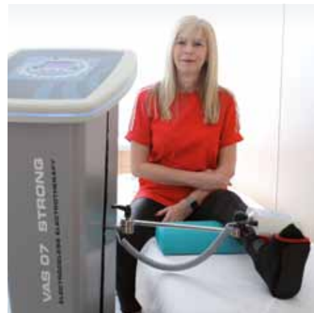
Distanční elektroterapii – VAS 07 lze aplikovat i přes oblečení nebo ortézu

Níže se můžete lépe seznámit s tím, jak ambulantní rehabilitace ve Slatinných lázních Třeboň probíhá v praxi. <