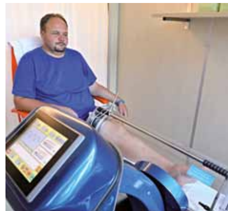
Průběžně rozšiřujeme a obnovujeme přístroje na obou lázeňských domech – na podzim 2024 například o přístroj Extremiter

Přístroj ICOONE v našem Fyziocentru – pomocník při regeneraci celého těla, odstraní i staré jizvy, omlazující účinky na vybrané části těla