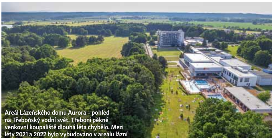
Areál Lázeňského domu Aurora – pohled na Třeboňský vodní svět. Třeboni pěkné venkovní koupaliště dlouhá léta chybělo. Mezi léty 2021 a 2022 bylo vybudováno v areálu lázní

Slatinné lázně Třeboň jsou zaměřené na léčbu onemocnění pohybového aparátu. Řeč byla o pracovišti ambulantní lymfologie a zmínili jste také přístroj Extremiter. Jak lymfologické pracoviště, tak uvedený přístroj jsou přínosem nejen pro obtíže spojené s pohybovým aparátem. Je to tak?