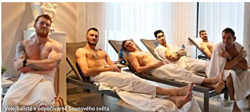
Volejbalisté v odpočívárně Saunového světa