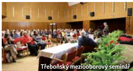
Třeboňský mezooborový seminář

Do třeboňských slatinných lázní nejezdí pouze klienti na léčení svého pohybového aparátu nebo na relaxační pobyty, ale příjemného a moderního prostředí využívají i firmy, společnosti a organizace k pořádání různých seminářů a kongresů. Jedním z kongresů je imunologický „Třeboňský mezooborový seminář“, který je opět pořádán v prostorách Lázeňského domu Aurora. Letos jde o 31. ročník (od 15. do 17. ledna). Na tři stovky specialistů z celé republiky zde oceňují prostorný a technikou vybavený Společenský sál, v němž se po tři dny konají přednášky a semináře, skvělé ubytování, vynikající kuchyni, možnosti relaxu v saunovém či vodním světě a skvělý personál. Velkou devízou je, že vše je pod jednou střechou.