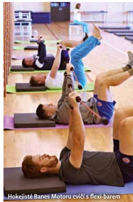
Hokejisté Banes Motoru cvičí s flexi-barem

musí zapojit hluboké vrstvy břišních i zádočných svalů, aby tělo této snaze o vychýlení odolávalo. Tím dochází k posilování. Přestože jsou hokejisté zvyklí na různé posilovací zátěže a cviky, flexi-bar je překvapil. Respektive prakticky ihned na vlastní kůži pocítili, kde všude se jejich vnitřní svaly nacházejí. Zejména když pro kameru museli zdánlivě jednoduché cviky provádět podstatně déle než běžní klienti lázní a prakticky bez odpočinku.