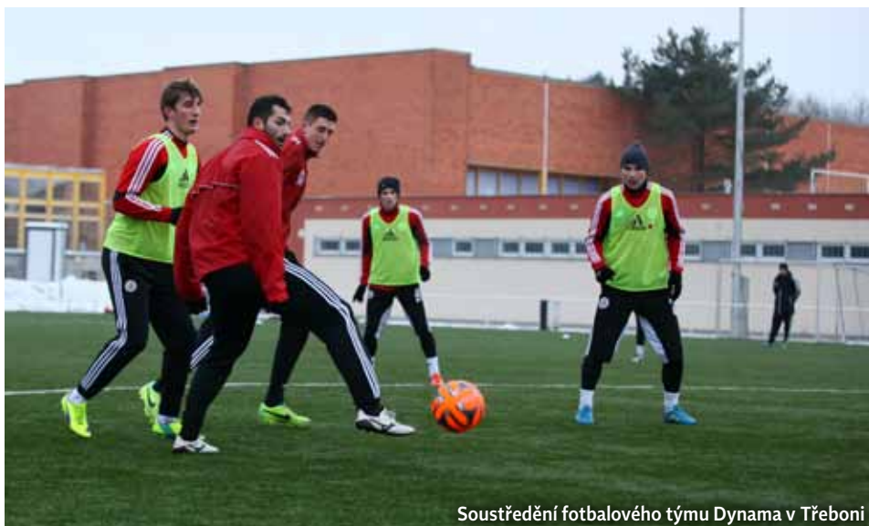
Soustředění fotbalového týmu Dynama v Třeboni

Podobně o pobytu v třeboňských lázních hovoří sportovci. Někteří sem jezdí na svá soustředění pravidelně, jiní občas. Mezi pravidelné klienty patří i fotbalové týmy českobudějovického Dynama. A-tým mužů prostředí třeboňských lázní využíval začátkem nového roku (od 6. do 10. ledna), přestávku mezi pod-