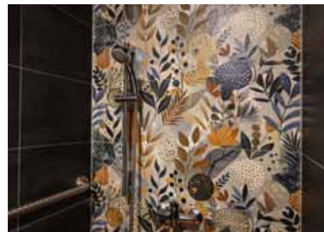
Sprcha navazující na slatinnou koupel