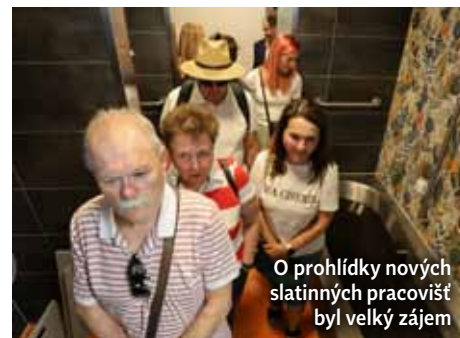
O prohlídky nových slatinných pracovišť byl velký zájem