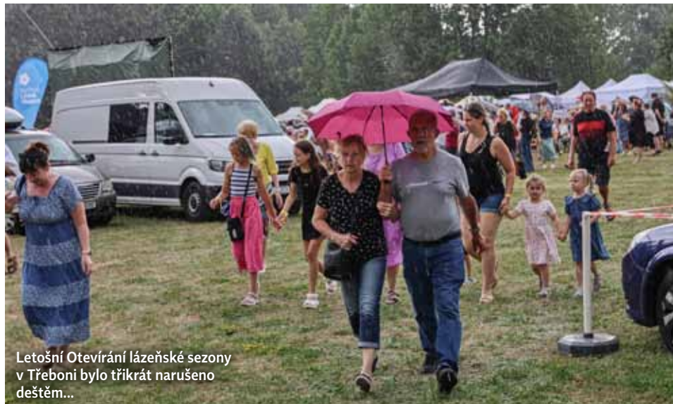
Letošní Otevírání lázeňské sezony v Třeboní bylo třikrát narušeno deštěm...