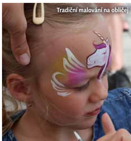
Tradiční malování na obličeji