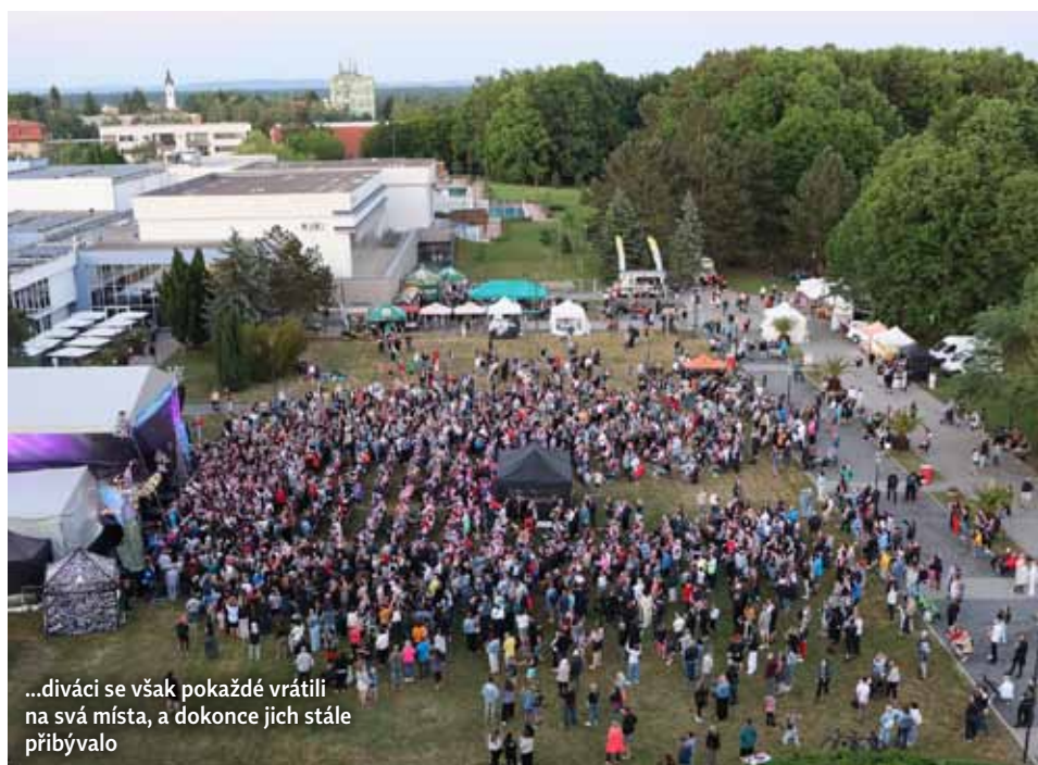
...diváci se však pokaždé vrátili na svá místa, a dokonce jich stále přibývalo

Program se neodehrával pouze na pódiu. Pro děti bylo připraveno malování na obličej, nafukovací skákací hrady, cesta pohádkovým parkem o ceny, venkovní kolonáda se proměnila v lázeňské trhy, nechyběly informační stánky pojišťoven, a především výborné občerstvení. <