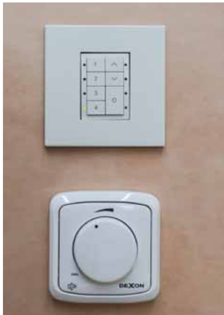
Ovládání světel – volba studené či teplé bílé a intenzity osvětlení, ovládání hlasitosti relaxační hudby