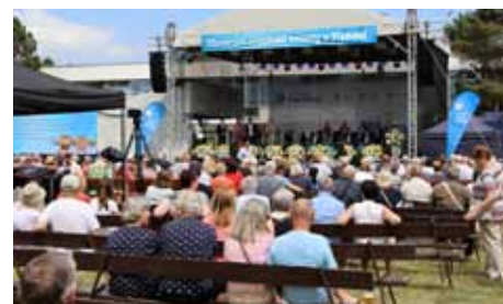
Úvod slavnostního dne patřil skvělému Rozhlasovému swingovému orchestru České Budějovice

jednoduché technické i technologické řešení, protože z investičního hlediska nejdůležitější nebyly vany, sprchy, masérny a odpočívárny, ale právě technologie, které jsou ukryty v podzemí. Připomněl, že komplikované – kromě napojení nových technologií na ty stávající – bylo například i najít výrobce nerezových van pro speci-