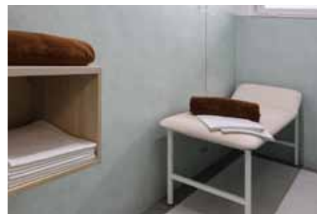
Odpočívárna, kde probíhá relaxace v suchém ovínu