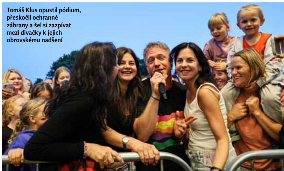
Tomáš Klus opustil pódium, přeskočil ochranné zábrany a šel si zazpívat mezi divačky k jejich obrovskému nadšení

Další saunová noc v Třeboňském saunovém světě je na programu v pátek 18. září.