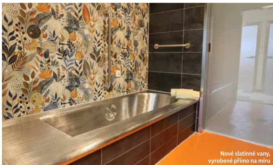
Nové slatinné vany, vyrobené přímo na míru

Součástí projektu jsou nejmodernější technologie pro přípravu a nahřívání peloidu (slati-