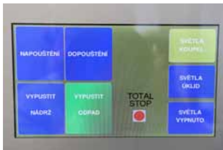
Multifunkční dotykové ovládání pro prostor slatinné vany